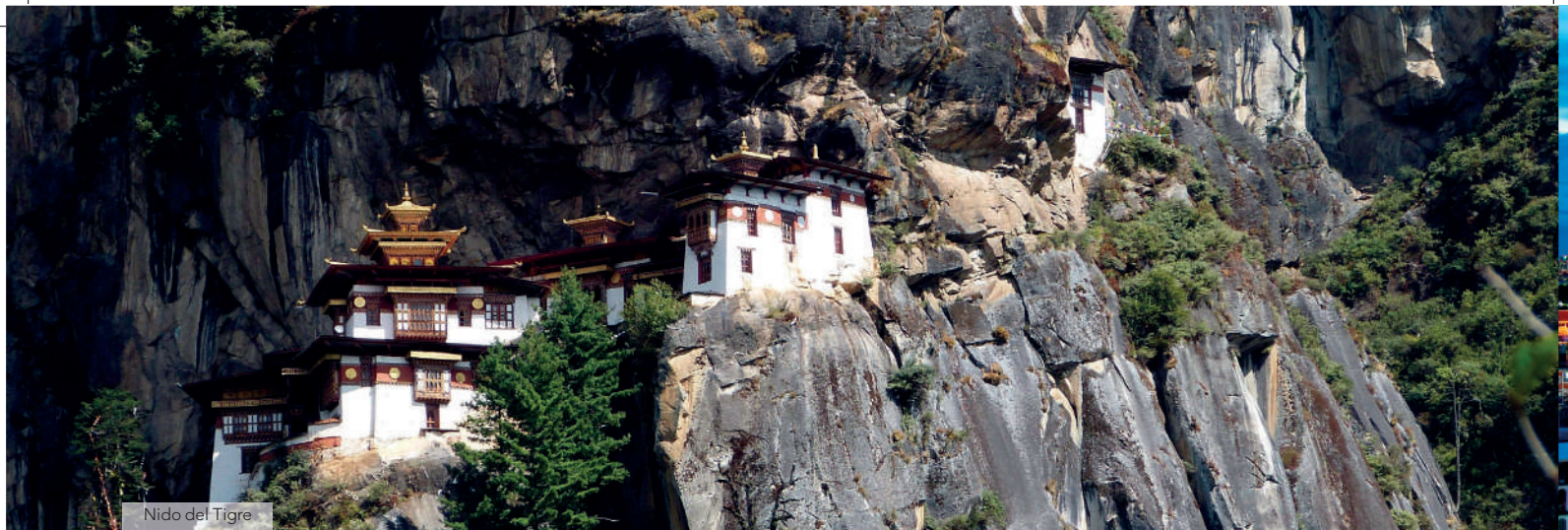
Nido del Tigre