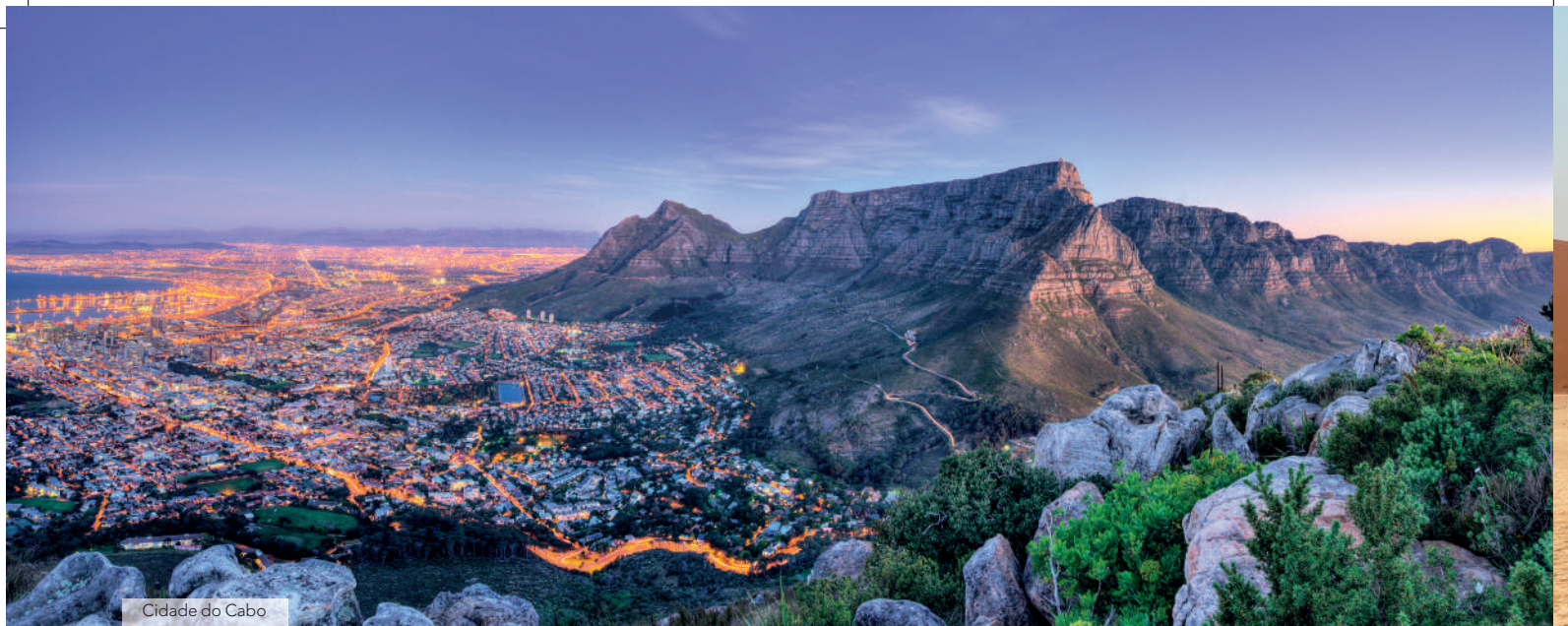
Cidade do Cabo